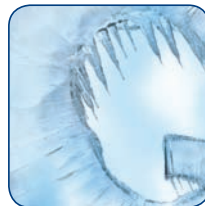
Gevoelig voor kou